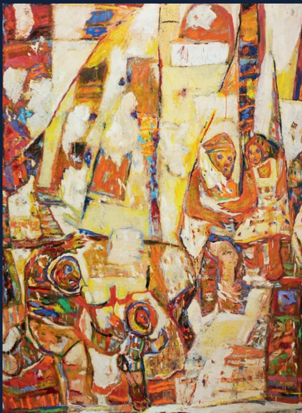
Kišno jutro, 205x155

Što je umjetnost nego li aluzija? Aluzija na nešto što smo zaboravili, na nešto što ne smijemo zaboraviti, opomena ili nagovještaj onog što nećemo smjeti zaboraviti. Kada govorimo, promatramo i mislimo o seriji slika Iris Jambreč, zasigurno pričamo o snažnoj ekspresionističkoj poetici čiji nas izraz vodi, ili kao što sama umjetnica kaže „aludira“ na neke autoričine, naše, ljudske svjetove koji su zaboravljeni, ali nam fragmentarno presijecaju svakodnevnu svijest. U ovoj seriji radova ulazimo u bajku, u neke priče iz ljudske nutrine gdje se isprepliče proživljeno i zamišljeno, gdje je teško prepoznati granicu koja zapravo možda nije ni važna. Usprkos šarenom koloritu i „veseloj“ kompoziciji Iris Jambreč nas usmjerava prema nekim okrutnim reminiscencijama. Poruke koje izlaze iz ovih platna nisu ugodne; one isijavaju bojazan i strah.