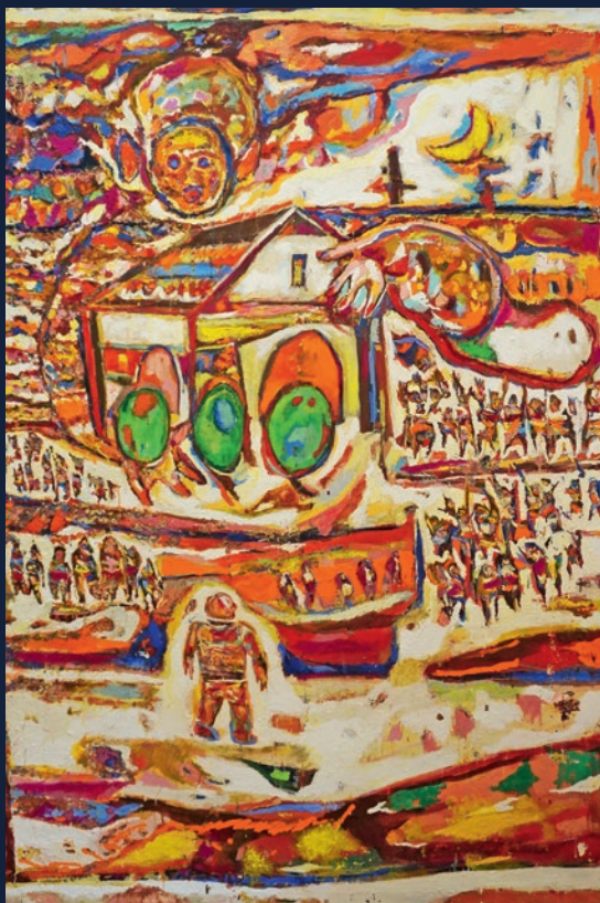
Noćna vještica, 200x130

sjećanja, čemu još više doprinosi kontrast te iste vizualne poetske naracije i naivnih naziva slika. Tek kad zagrizemo ispod i pogledamo u likove grčevitih izraza koji su više prikaze no živa bića, izlazimo iz konkretnog viđenog i ulazimo u bezdane vlastitih evokacija. Kao što i sama autorica ističe, imaginacija je veoma važan element u stvaranju ovih radova.