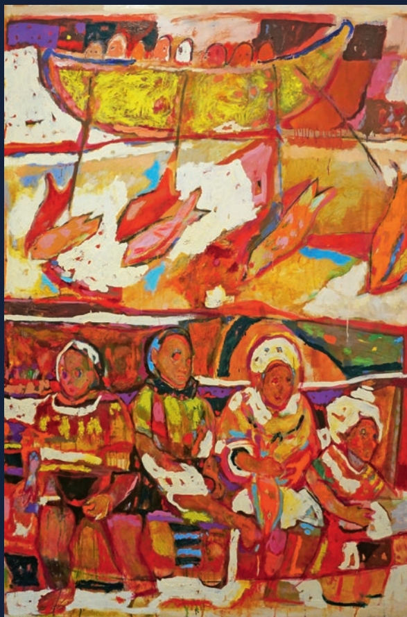
Vrijeme lova, 205x135

poznatom te samo naizgled jednostavnom ikonografijom, dobivamo težinu dijabolične poetike koju ova djela sadrže. Izbor bogate guste teksture i ekspresivnog kromatizma u kojem dominiraju zemljane boje ističu nam sposobnost ove mlade umjetnice da prepozna kako na pravi način preko platna otkriti labirint imaginativnog bogatstva.