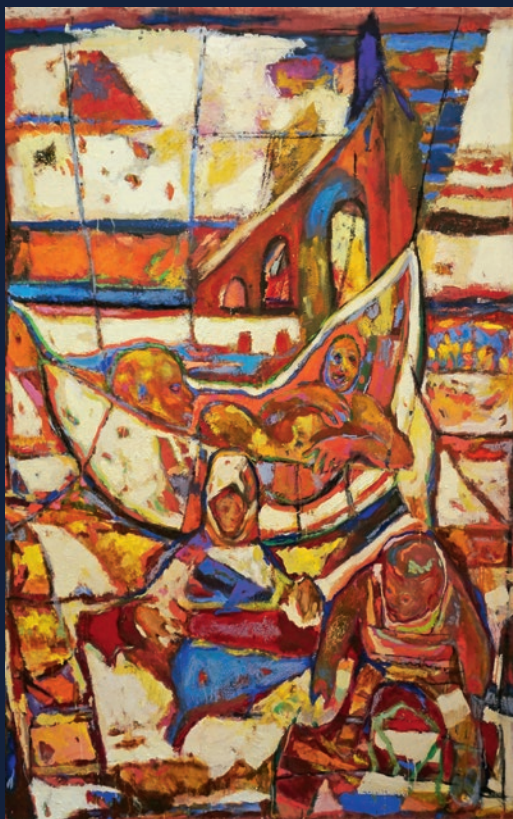
Popodnevni misterij, 205x135

i individualno – u sebi sadrže pojedinačne male događaje koji su u našoj svijesti dobili gotovo sakralno mjesto.