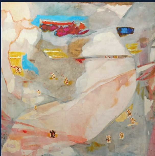
Igra u zoru, 200x200

Iris Jambrek rođena je 1995. godine u Varaždinu. Osnovnu školu završava u Samoboru, nakon čega upisuje Školu primijenjene umjetnosti i dizajna u Zagrebu. Akademiju likovnih umjetnosti Sveučilišta u Zagrebu upisuje 2015. godine, gdje završava preddiplomski studij slikarstva 2019. godine, te iste godine dobiva pohvalu Akademijskog vijeća cum laude. Trenutno završava diplomski studij slikarstva u klasi profesora Zoltana Novaka.