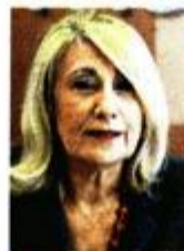
Incijatorica Muzeja medija

– Zanimaju me samo prvi brojevi jer smatram da se u njima najbolje ogledaju kapaciteti neke redakcije. Oni su koncentrat sveg novinarskog znoja uloženog u porinuće novog lista – ocijenio je pokazujući nam ponosno naslovnice koje se kreću od uvjerljivo najvrednijeg prvog broja Kraljskog Dalmatina, koji je odlukom samog Napoleona porinut 1806. u Zadru, do prvog broja Forum.tma, Le Mondea i drugih recentnih izdanja od kojih su neka, nažalost, već ugašena.