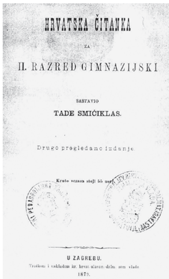
Naslovnica drugog izdanja Smičiklasova udžbenika Hrvatska čitanka za II. razred gimnazijski