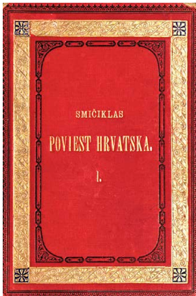
Naslovnica prvog sveska Smičiklasove sinteze hrvatske povijesti u izdanju Matice hrvatske – Poviest hrvatska

Položivši maturu, Smičiklas je otputovao u Osijek, gdje je kao »namjesni učitelj« na gimnaziji radio od travnja 1863. do lipnja sljedeće godine. Za to je vrijeme službovanja, uz pedagoški rad, marljivo prikupljao narodne pripovijesti iz osječke okolice, ponajviše »u donjem gradu Osijeku«, koje je objavljivao u Zborniku za narodni život i običaje Južnih Slavena JAZU , počevši od XV. sveska pa nadalje. Uskoro mu je uspjelo isposlovati trogodišnju stipendiju od Dvorske kancelarije za studije povijesti i zemljopisa na Sveučilištu u Pragu. No, nakon prve je godine studija prešao na Sveučilište u Beč kao redoviti slušatelj odjela za povijesne znanosti, gdje je svojim radom 1866. god. zaslužio prijam