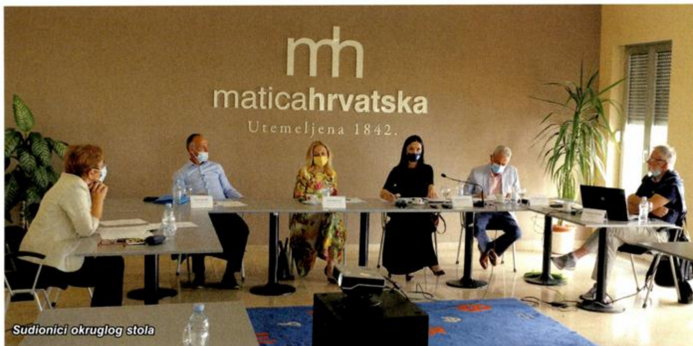
Sudionici okruglog stola

-Nije bilo moguće konkurirati međusobno, a sad se izjednačavaju OPG-a, obrti, velika i mala poduzeća, a to nije dobro i OPG-ovi tu neće dobro proći, naglasio je.