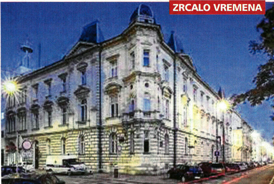
Zgrada Matice hrvatske u Zagrebu

Krajem 1879. godine Naša Sloga objavila je informaciju o uspješnom napretku MH; za godišnju pretplatu od tri forinte svaki član dobije osam do devet knjiga. Te godine u Maticu je bilo uključeno oko 3000 članova; u Istri, bez otoka, a s Trstom, bilo je stotinu članova, a povjerenike je Matica imala u središtima tadašnjih kotara: Trstu, Kopru, Pazinu, Kastvu, piše dr. Nevio Šetić (O pove-