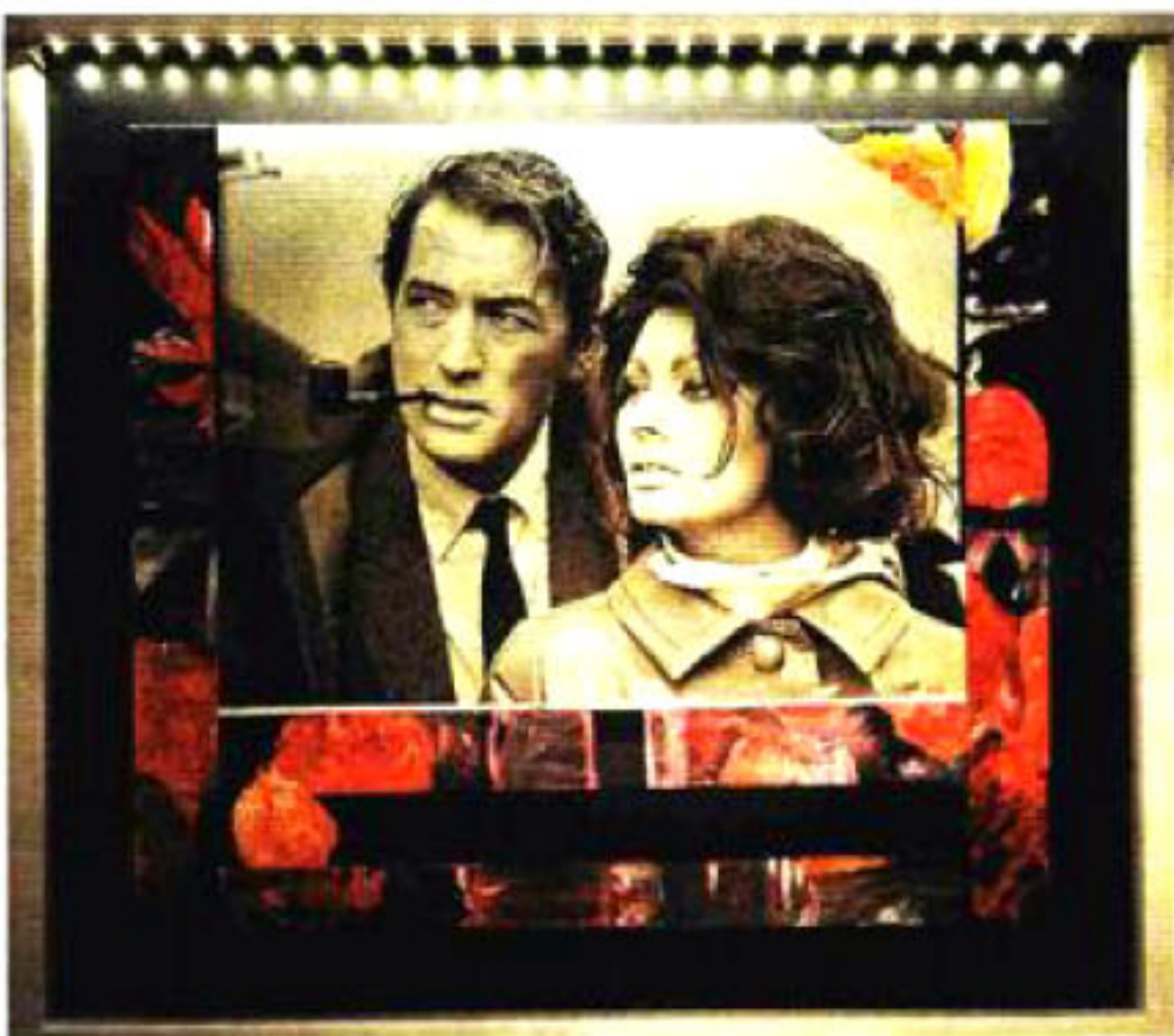
Gregory Peck i Sofia Loren u filmu »Arabska«