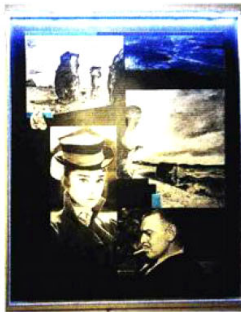
Audrey Hepburn, Clark Gable, jedan od radova s izložbe