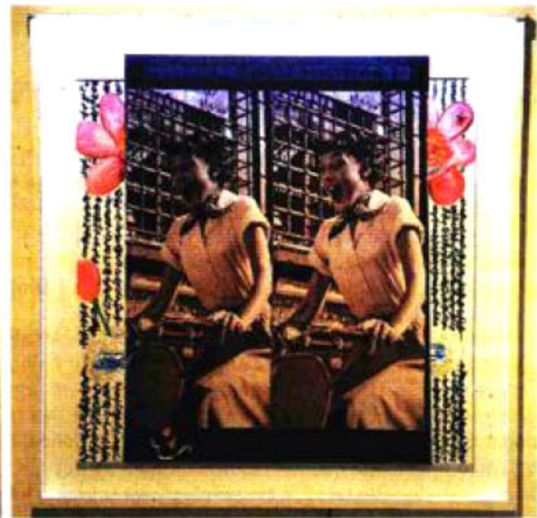
Audrey Hepburn u »Prazniku u Rimu«