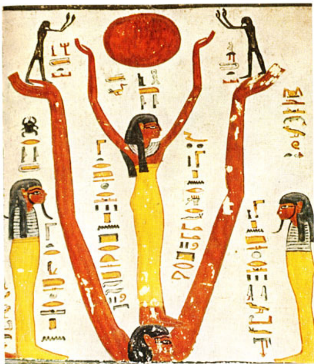
Prikaz mističnog Ka , besmrtna duša koja prebiva u svakom biću

Pojam Ka likovno se prikazuje s dvije pravokutno uzdignute ruke i dlanovima okrenutim od tijela. Pitamo se, ne odnose li se na Ka svi posmrtni plesovi u kojima plesači čine slične geste?