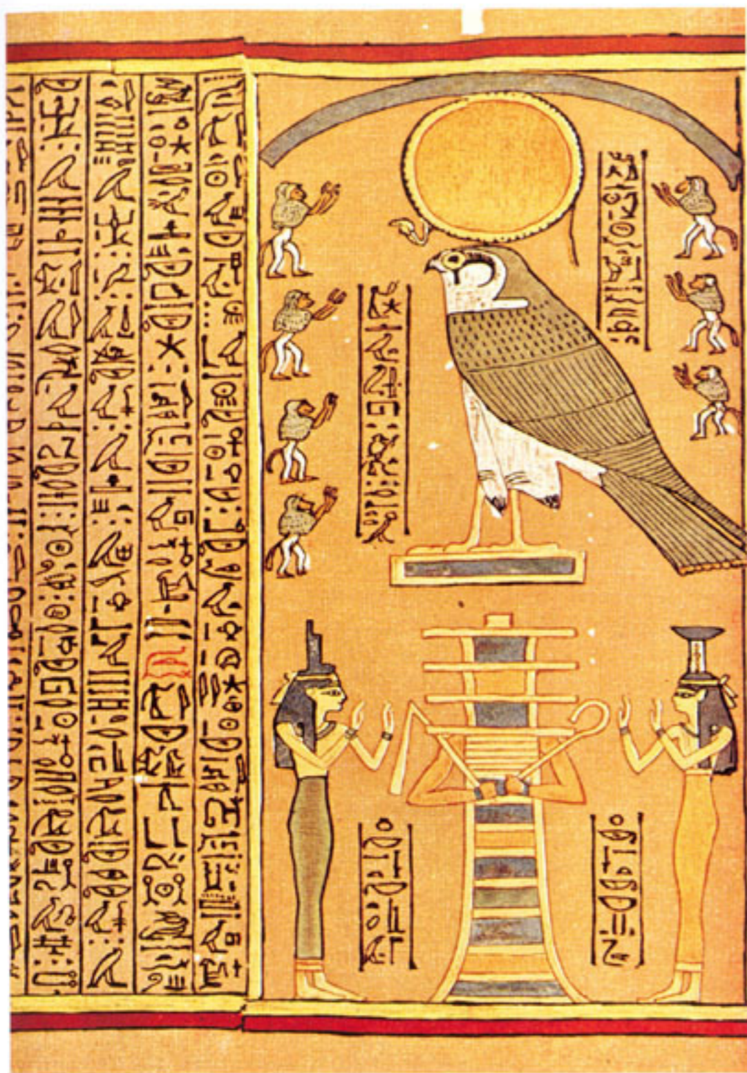
Izida i Neftis u gesti obožavanja Ozirisa. Egipatska knjiga mrtvih. Papirus Ani