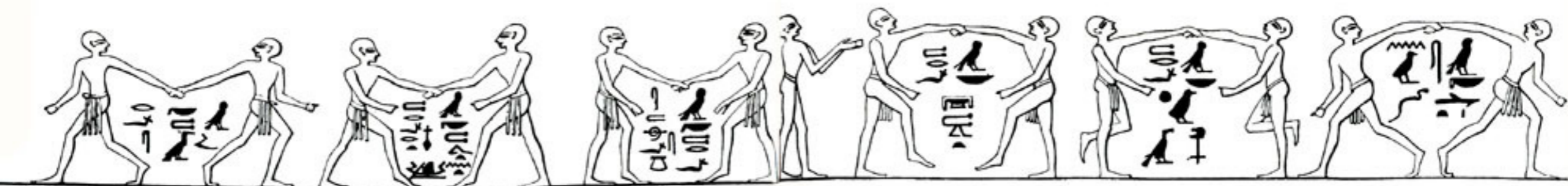
Ples u parovima plesali su jednako robovi kao i slobodni građani Egipta

Grobovi i grobnice otkrivaju pogrebni ceremonijal staroga Egipta u svim njegovim fazama.