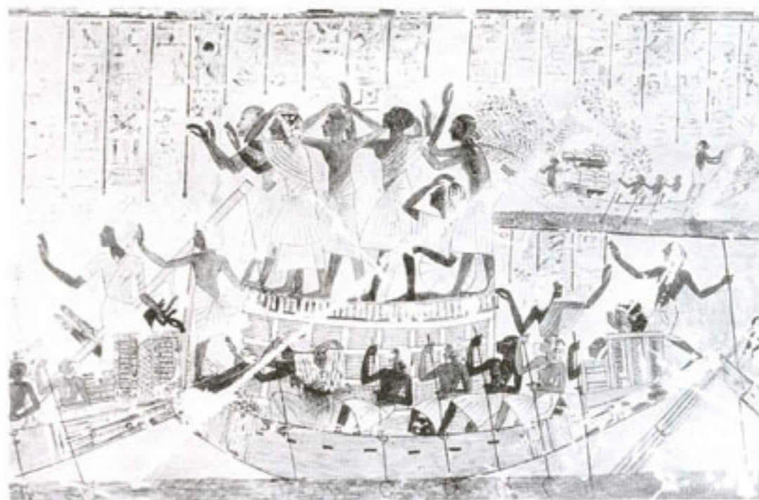
Lada koja prevozi uplakane: slika iz grobnice Nefertotepa u Tebi. XVIII. dinastija

Za Ozirisom, kao za mrtvim bogom žita, žalili su nakon žetve kada su polja presahla. No on je za čitave godine prisutan u izvanredno razvijenom kultu mrtvih. Egipćani su u zagrobnom životu vidjeli simbol i obećanje sretnoga uskrsnuća, brigu i ljubav i odanost živih za pokojnika, kao što to čini Izida za svoga božanskoga supruga. Posmrtnim su ceremonijama posvećivali osobitu pozornost. Pri pogrebima, odvijao se prikaz božanske misterije točno utvrđenim slijedom. Na tim su svečanostima profesionalne narikače predstavljale Ozirisove sestre Izidu i Neftis, dok su muški izvođači predstavljali Anubisa, boga podzemlja, Horusa i čitavu božansku hijerarhiju. Na slici iz Knjige mrtvih (Papirus Ani) vide se Izida i Neftis u gesti obožavanja Ozirisa, koji je simbolično predstavljen središnjim stupom. Nad njima je lik sokola, sim-