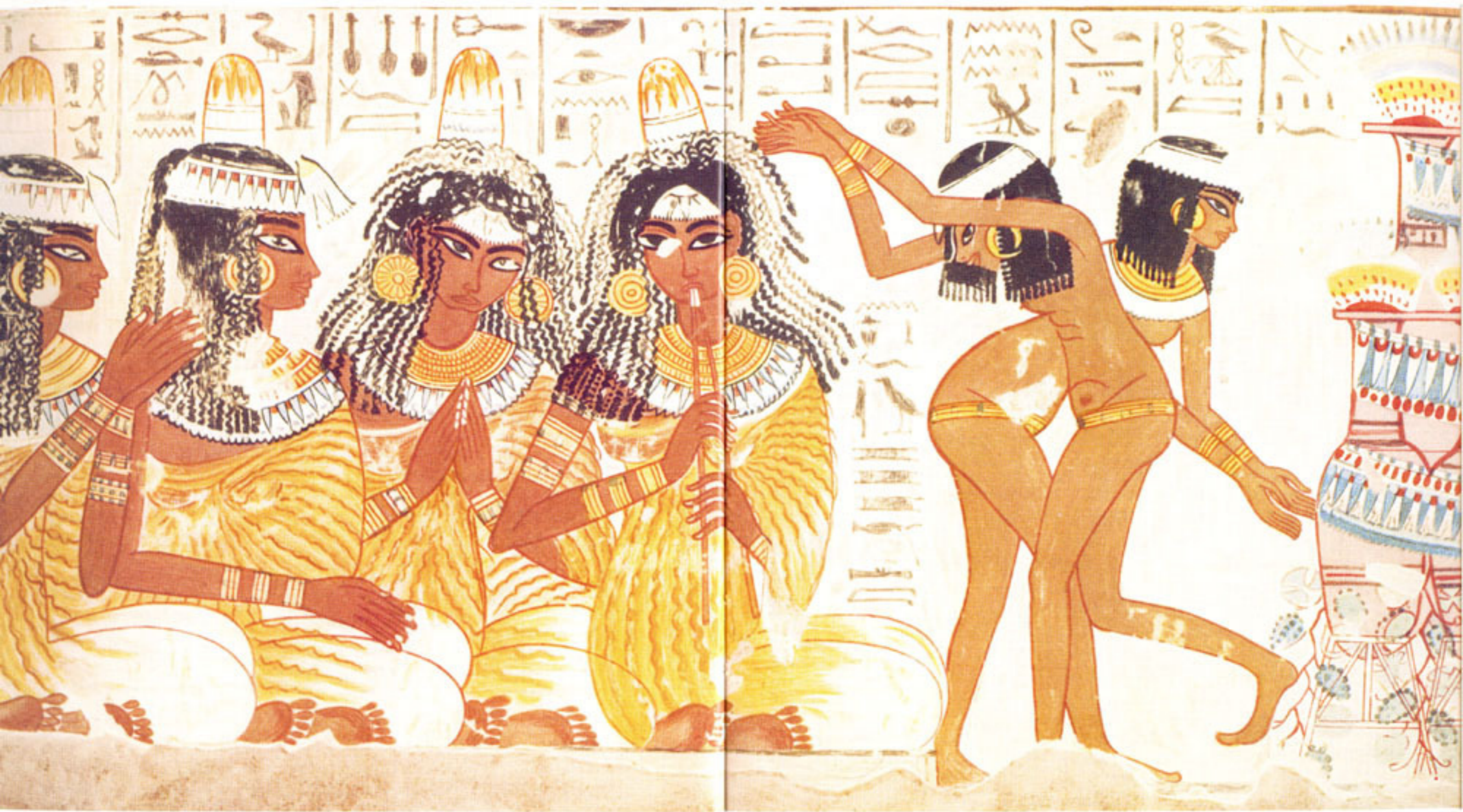
jevačice i plesačice: slika sa stijene nekropole iz XVIII. dinastije u Tebi