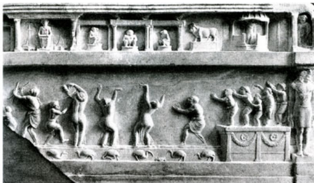
Mramorni reljef iz Via Appia u Rimu

ju i udaranjem dlana o dlan. Slika u svakom slučaju dokumentira tipične značajke plesnog stila Nove države: neusiljenost, slobodu uz erotski naboj.