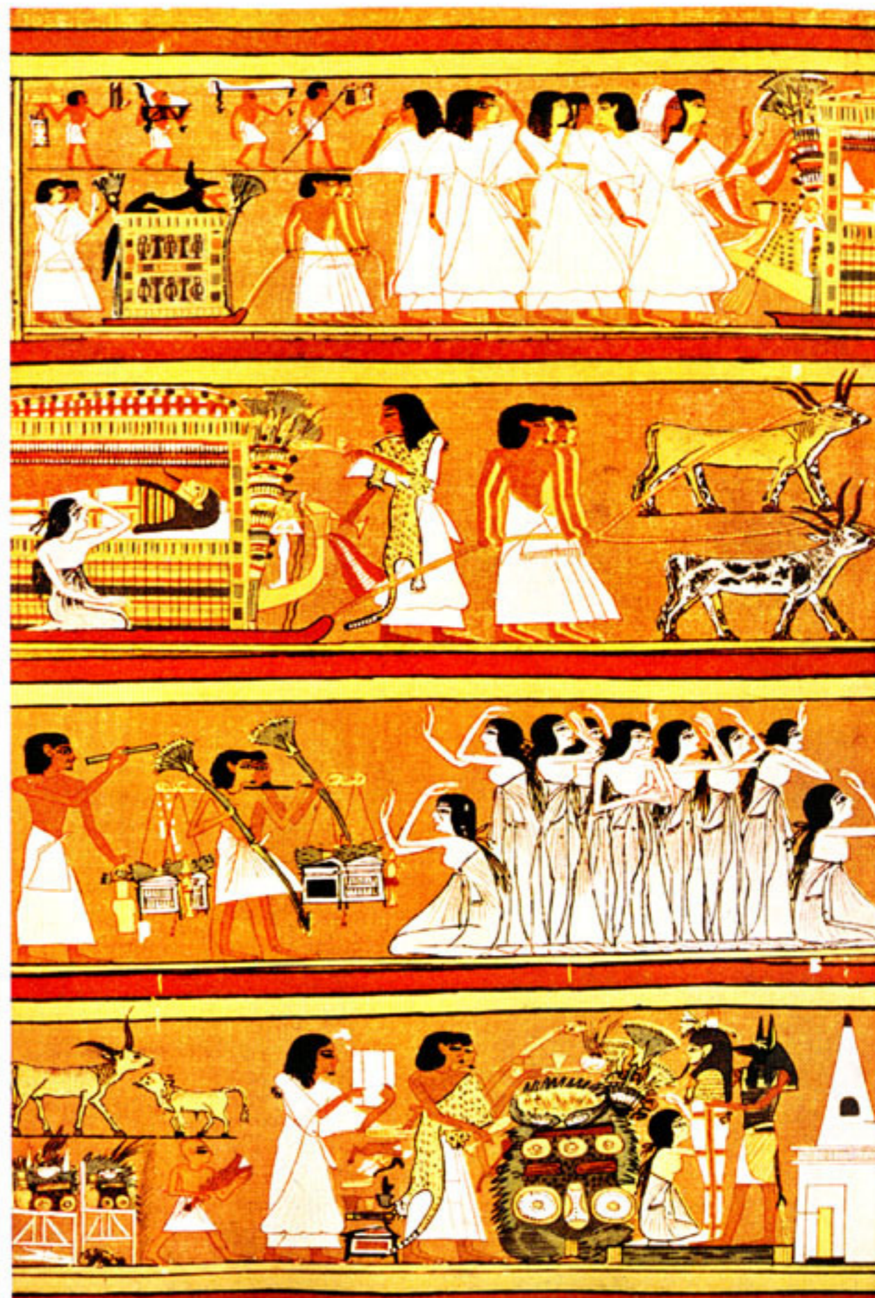
Prikaz pogrebne povorke, Egipatska knjiga mrtvih, Papirus Hunefer

I slika u grobnici u Beni-Hasanu djeluje vrlo plesno. Tu djevojke žongliraju s loptama u raznim stavovima, skaču uvis, a jedna se čak popela na svoju suigračicu. Lopta je prvobitno bila simbolom sunčeve kugle, pa tako veza s kultom ni ovdje nije isključena.