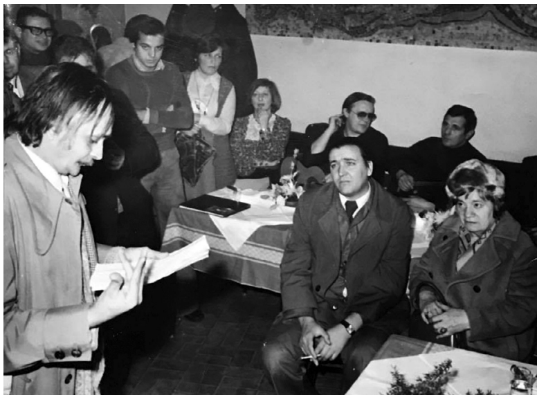
Sever u zagrebačkoj gostionici Tip-Top, na uglu Gundulićeve i Masarykove ulice, na godišnjicu smrti Tina Ujevića 12. studenog 1980. u sklopu programa "Sjećanje na Tina"