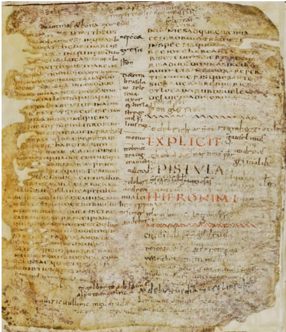
Čedadski evanglijarij (Cividale del Friuli, Museo Archeologico Nazionale. Archivi e Biblioteca, Cod. CXXXVIII, Evangeliarium, fol. 2r)