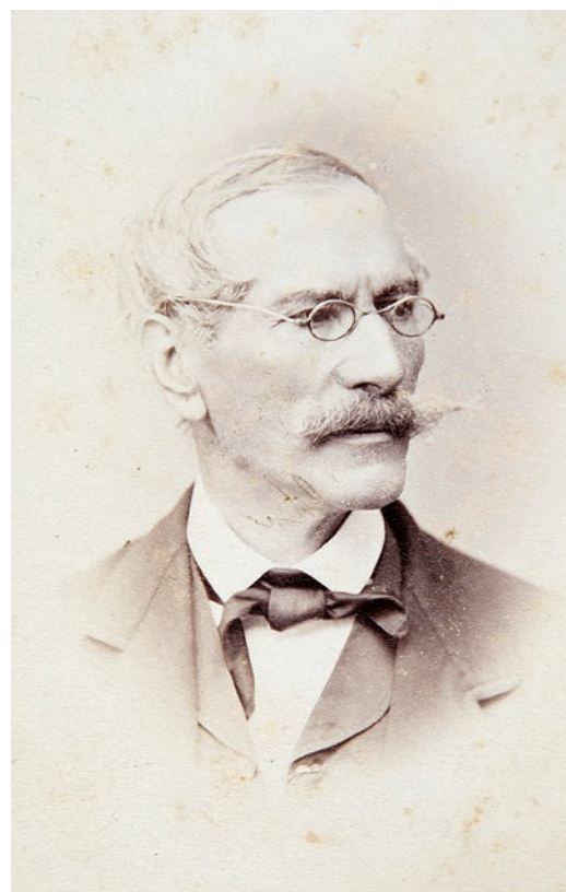
Nikola Vranyczany-Dobrinović (1804–1876)

Iako je Nikola općenito manje sudjelovao u hrvatskom javnom životu od brata Ambroza ml., intenzivno je sudjelovao u društvenom i gospodarskom životu Karlovca, osobito unutar skupine rodoljubno orijentiranih stanovnika grada. Tako je, među ostalim, na njegovu inicijativu u Karlovcu već 1838. otvoreno Ilirsko društvo čitanja , što je nakon varaždinskoga Varaždina bila druga ilirska čitaonica u Banskoj Hrvatskoj, 146 a na njezinoj osnivačkoj skupštini Nikola je izabran za jednog od četiri savjetnika toga društva. 147 Iako se utjecaj rodoljuba