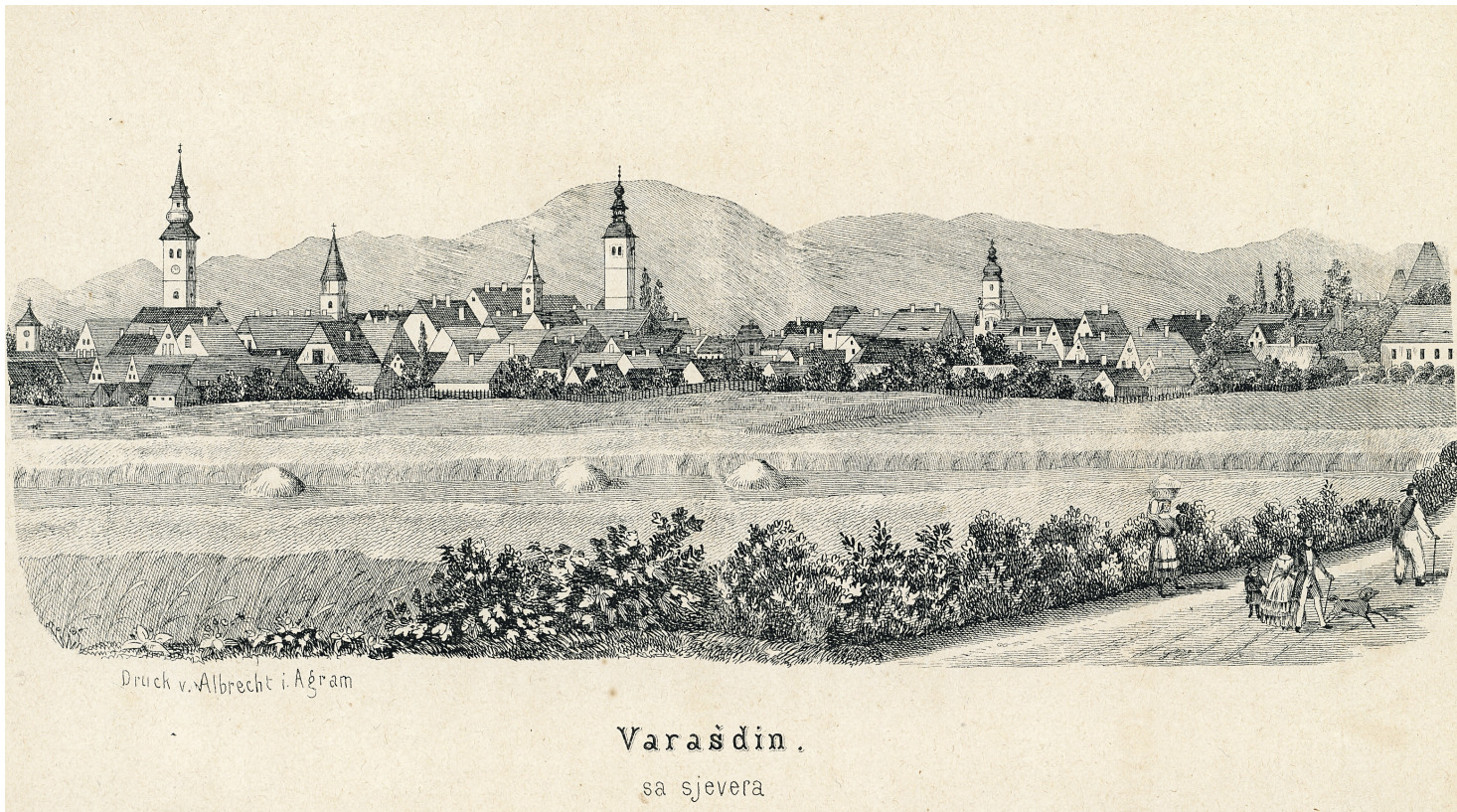
Kukuljevićev rodni Varaždin

Zastupao je „pragmatički“ način pisanja povijesti, odnosno interpretaciju povijesnih događaja na temelju uzročno-posljedičnih veza, a od povjesničara je zahtijevao objektivnost, ali i pisanje u slavenskom duhu. Povijesna istraživanja, prema njegovu mišljenju, trebala su pridonijeti buđenju nacionalnoga ponosa i izgradnji nacionalnog identiteta. Tijekom 1850-ih mnogo je putovao u potrazi za povijesnom građom i o tome je objavio