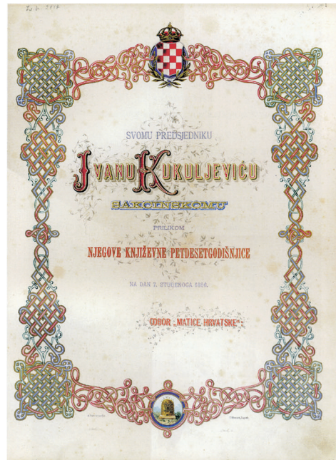
Spomen-album odbornika Matice hrvatske posvećen predsjedniku Ivanu Kukuljeviću Sakcinskom iz 1886.

smrti. Pod njegovim vodstvom sagrađena je Matičina palača, a Matica je postala pokretačem književnog i znanstvenog stvaralaštva u Hrvatskoj, izdavala je književna i znanstvena djela domaćih autora, ali i zanimljive prijevode svjetskih klasika i suvremenih autora.