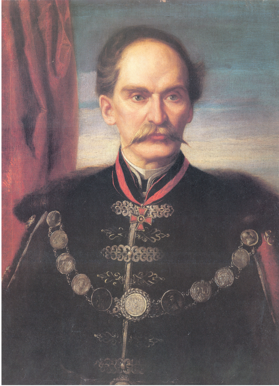
Ivan Kukuljević Sakcinski (1816–1889) na portretu Alberta Mosesa iz 1876.

i u županijskim skupštinama, a 23. listopada 1847. Hrvatski sabor narodni jezik proglasio je službenim.