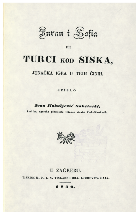
Najpoznatiji Kukuljevićev dramski komad

Bio je dugogodišnji potpredsjednik Matice ilirske, na čelu njezina književnog odbora (1851–58), a u studenome 1874. izabran je za predsjednika Matice hrvatske, što je ostao do