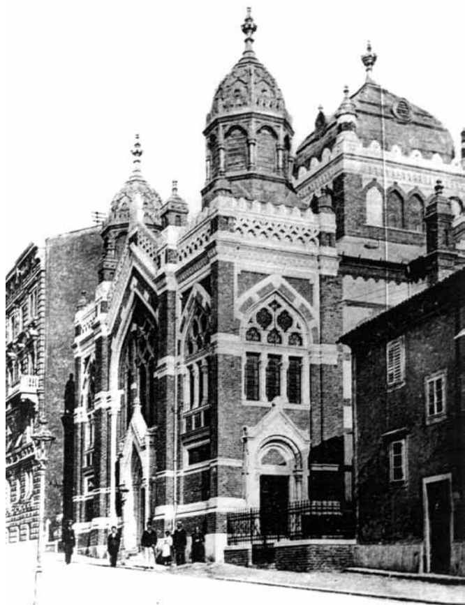
Riječka sinagoga (1903–1944)

Od nekadašnjih stotinjak sinagoga danas ih je sačuvano samo devet objekata koji su izvorno namijenjeni sinagogalnoj funkciji: Varaždin, Koprivnica, Križevci, Daruvar, Bjelovar, Osijek – Donji grad, Rijeka, Sisak te Podravska Slatina. Svi navedeni objekti, osim ortodoksnе sinagoge u Rijeci, posljednjih su desetljeća služili u profane svrhe (npr. za kino, glazbenu školu, kazalište, robnu kuću i sl.). Samo neki gradovi postavili su spomen-obilježja na mjestima negdašnjih sinagoga, dok se jedino u Zagrebu već dulje vrijeme ozbiljno raspravlja o mogućnostima obnove sinagoge ili izgradnje suvremenoga centra u Praškoj ulici.