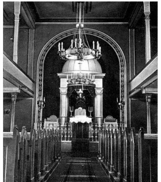
Nekadašnji interijer koprivničke sinagoge

sinagoga utjecala su i neka druga stilska obilježja, npr. obilježja secesije, kasnog akademizma, art deco -stilizacije i moderne. Treba naglasiti kako to nisu prve sinagoge na hrvatskom tlu. Tragove građevina za vjersku službu nalazimo već tijekom antike, npr. proseucha u Mursi, ali i tijekom srednjeg vijeka, npr. sdorium u Splitu iz 1397, ili zagrebački Domus Judeorum iz 1444. No do pojave samostalnih reprezentativnih sinagogalnih građevina većina sinagoga na području Hrvatske bila je uređena tek interijerski, u adaptiranim prostorima. Najviše je sinagoga bilo u Slavoniji i sjeverozapadnoj Hrvatskoj, i to većina njih reformiranog aškenaskog obreda, dok ih je samo nekolicina bila ortodoksnih (Ilok, Zagreb, Rijeka) ili sefardskih u obalnim gradovima (Split i Dubrovnik). U Zagrebu je tijekom povijesti