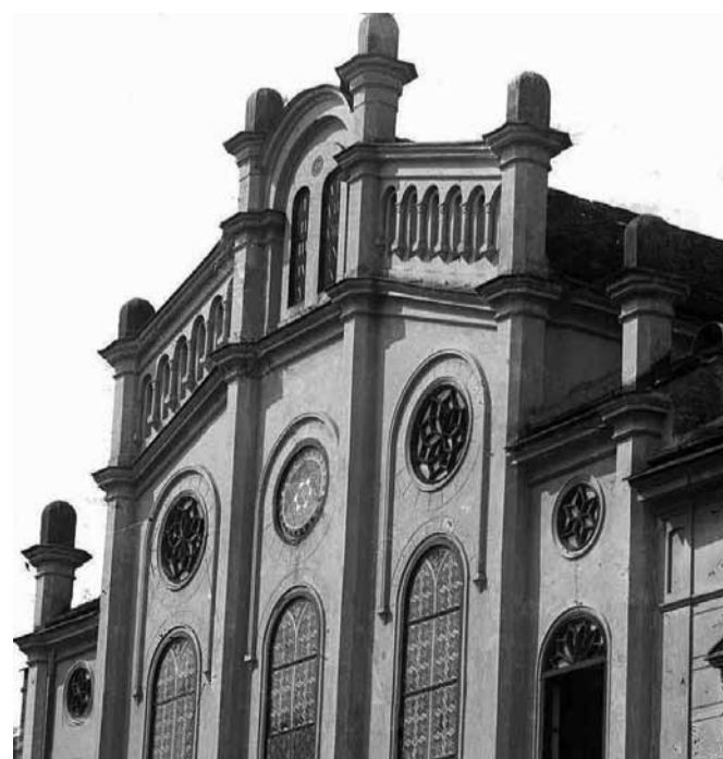
Sinagoga u Karlovcu (1871–1942)