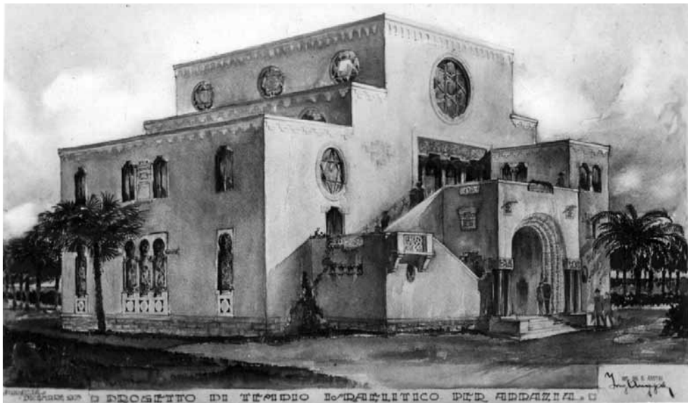
Zgrada nekadašnje sinagoge u Opatiji

registrirano čak dvanaest objekata za židovsku molitvu, ali je tek sinagoga u Praškoj ulici bila projektirana kao veliki hram – sinagoga.