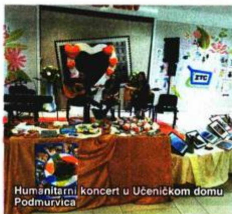
Humanitarni koncert u Učeničkom domu Podmurvica