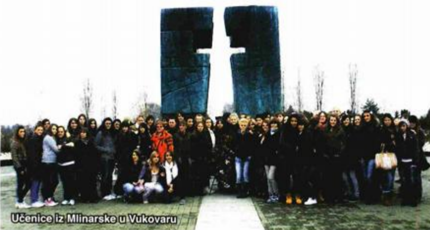
Učenice iz Mlinarske u Vukovaru