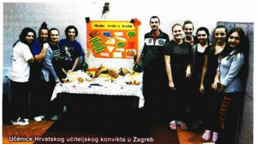
Učenice Hrvatskog učiteljskog konvikta u Zagreb