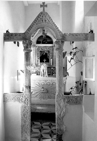
Jedina oltarna pregrada koja se još nalazi na svom mjestu u maloj crkvi iznad glavnog ulaza u Dioklecijanovu palatu u Splitu