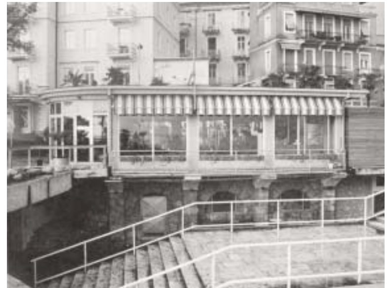
Cafe Panciera u Opatiji Bruna Angheben

Već uvodni tekst akademika Velimira Neidharta poziva hrvatsku kulturu i njezine institucije da izvrše kapitalan zadatak sinergijske sinteze hrvatske arhitekture u 20. stoljeću, odnosno, odrede dosege hrvatske arhitekture u europskom kontekstu. Sam pisac predlaže kronološki raspored od antičke umjetničke baštine koju Hrvati integriraju u svoj urbani