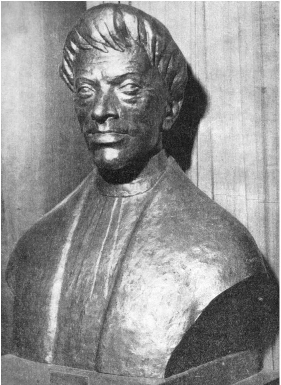
Skulptura Marina Držića, djelo Bože Obradovića, nekoć u atriju beogradskoga Narodnog pozorišta, danas izgubljena.