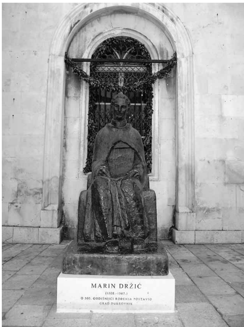
Spomenik Ivana Meštrovića Marinu Držiću u Dubrovniku.