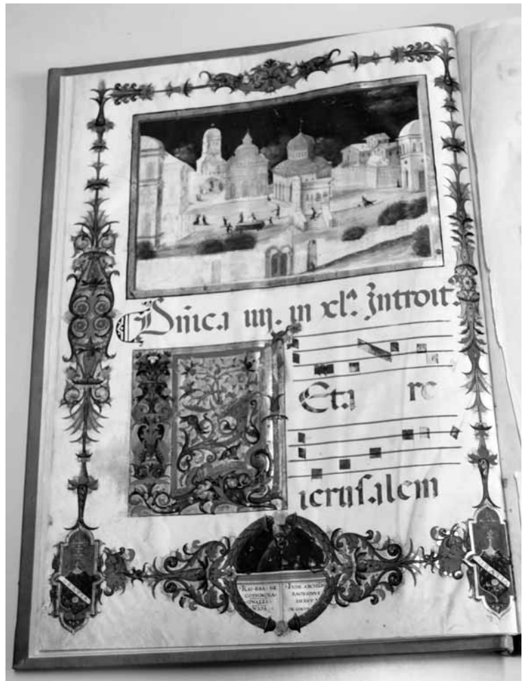
Naslovnica graduala sa slikom imaginarnog Dubrovnika i kazališnog prizora na gradskom trgu.