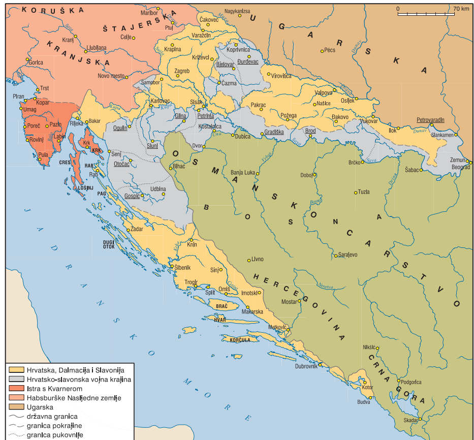
Hrvatske zemlje 1848.

za cijelu Monarhiju, odnosno odustati od faktične samostalnosti svoje zemlje. Mađarima je neprihvatljiv bio i zahtjev za priznavanjem Srpske Vojvodine.