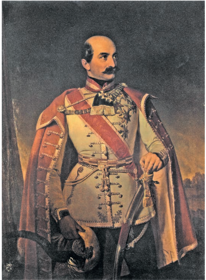
Ivan Zasche, Josip Jelačić Bužimski (1801–1859), ulje na platnu (Hrvatski povijesni muzej, Zagreb)

Oporbena orijentacija u tadašnjoj Hrvatskoj nije značila postojanje neke organizirane protuaustrijske skupine, iako je vjerojatno bilo pojedinaca s takvom orijentacijom. Nacionalna isključivost mađarskog pokreta onemogućavala je bilo kakvo povezivanje hrvatske i mađarske politike. Postoje fragmentarni podaci o antiaustrijskoj aktivnosti nekih pojedinaca – poput Dragutina Kušlana, urednika Slavenskog Juga , koji je u svibnju 1849. u Beogradu razgovarao s predstavnikom mađarske vlade – ali oni nisu imali veće značenje. Hrvatska službena politika nastojala je ići srednjim putem, tj. bez direktne konfrontacije s austrijskom vladom, ali i bez namjere