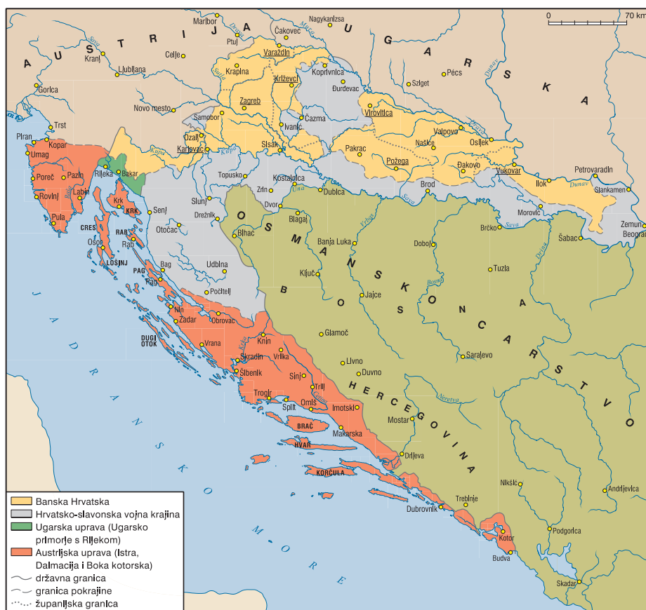
Hrvatske zemlje početkom 19. stoljeća

Kao posljedica dugotrajnih protuturskih ratova od 15. do 18. stoljeća Austrija i Habsburgovci pojavili su se kao glavna kršćanska politička snaga u središnjoj i jugoistočnoj Europi. Različitim mjerama nastojali su u 17. i 18. stoljeću ojačati ustanove središnje vlasti i svoju heterogenu državu, sastavljenu od mnogo pokrajina s različitim povijesnim nasljedem, pretvoriti u modernu centraliziranu monarhiju po uzoru na tadašnju Francusku. U zapadnim pokrajinama svoju su centralističku politiku Habsburgovci mogli provoditi relativno nesmetano, ali na veliki su otpor naišli u istočnim područjima, posebno Ugarskoj, Erdelju te Hrvatskoj i Slavoniji. Sve češća centralizacijska nastojanja iz Beča, praćena nametanjem njemačkog jezika, dovela su krajem 18. stoljeća do reakcije privilegiranih staleža u Hrvatskoj i