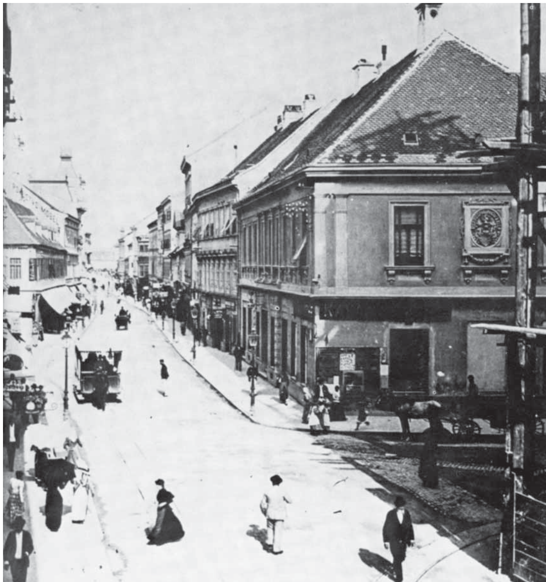
Ilica godine 1893.

»Konvenat se i obvezao, da uzdržava za bolnicu nužno osoblje i da uzdržava sebe od viška fundacija, od plaćenih kreveta, milodara i od dohoda ljekarne.