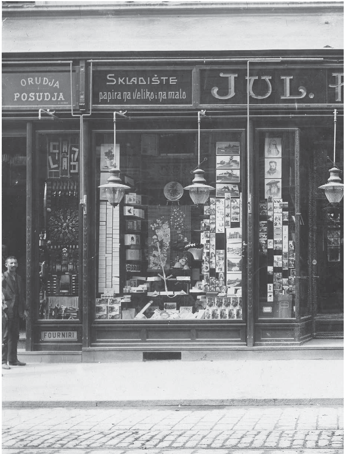
Trgovina Juliusa Hühna