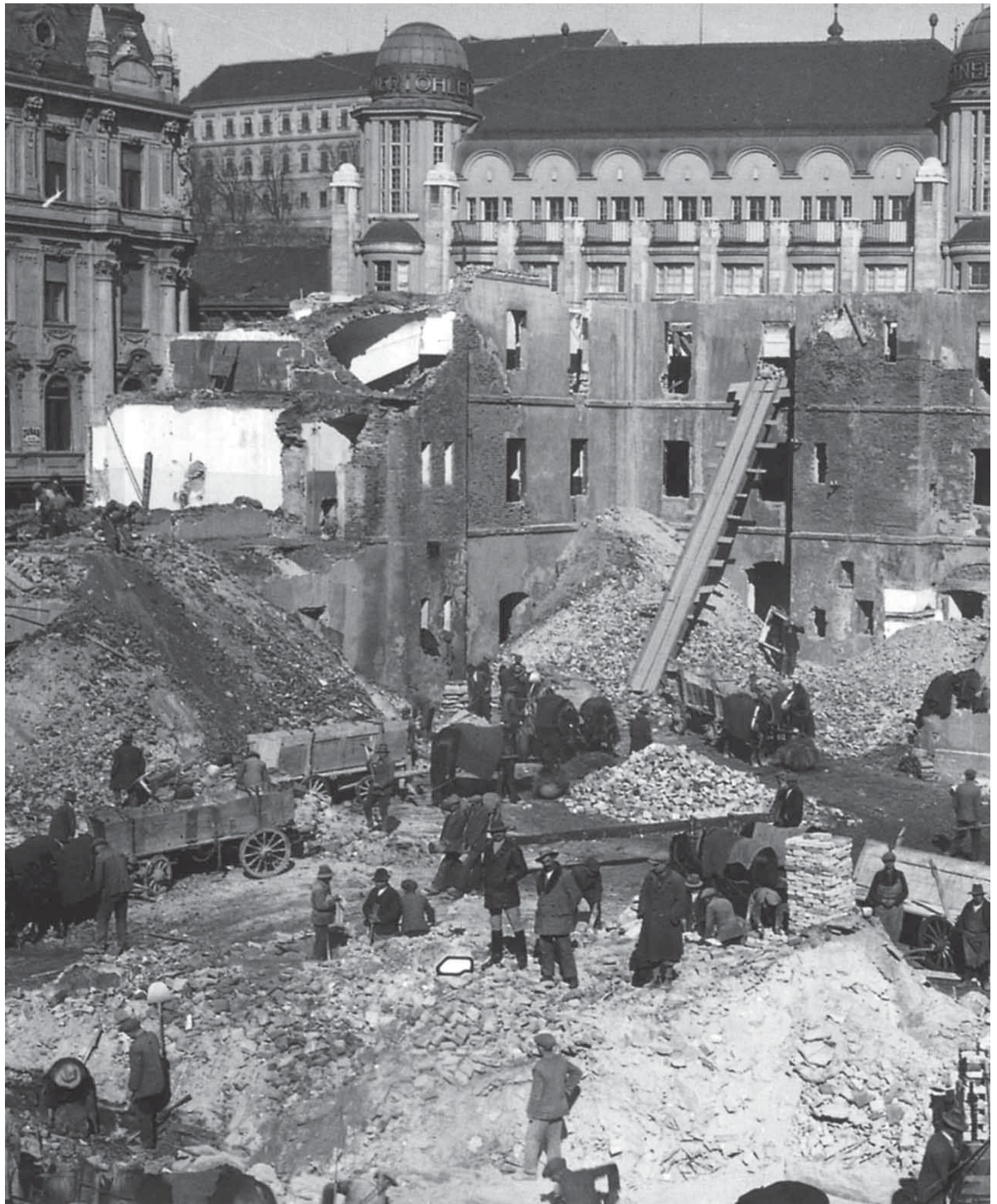
Rušenje bolnice na Trgu bana Jelačića