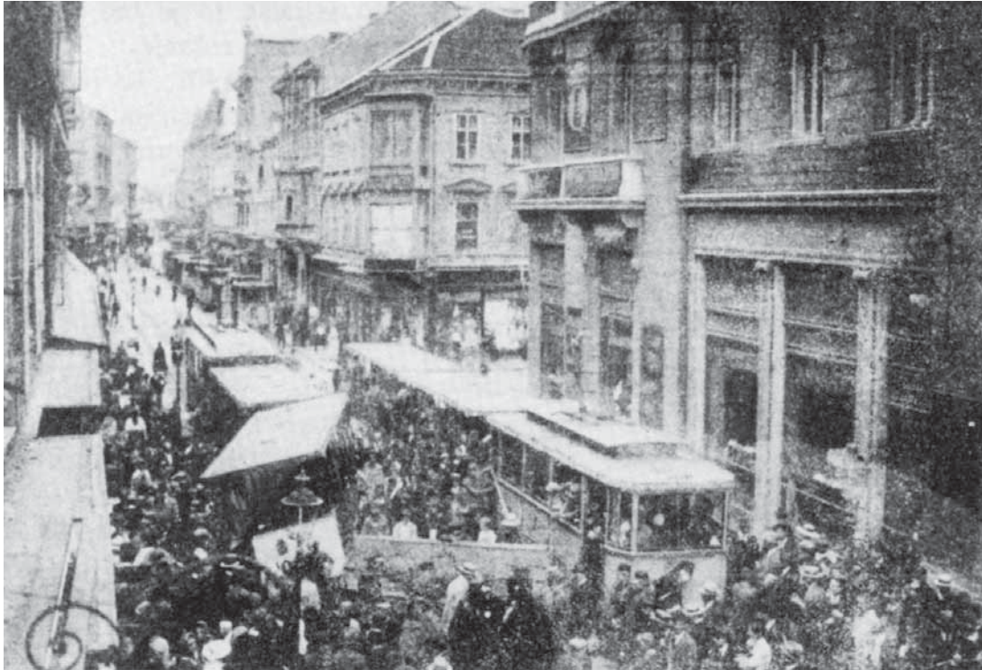
Sudar tramvaja u Ilici 1917.

Pogled iz Ilice na Harmicu bijaše sjajan, tu se uzdizao 17 hvati (!) visok dorski stup oko kojega se redalo 12 manjih stupova, koji bijahu visoki 3 hvata, a svi stupovi razsvietljeni sa 3000 lampica i 49 raznobojnih balona. Dvospratnica Josipa pl. Kuševića, 365 savjetnika i sudca bijaše ukrašena slikama i nadpisima, što bijahu razmješteni na 12 prozora. Na stanu Eigelovu uzdizale su se dvie piramide sa 250 lampica. Kod Šoštarića bijaše pokretno sunce, kod trgovca Merherra izložena slika cara i carice, dok je na tridesetnici sjao u brojnim plamičkima dvoglavi orao. 366