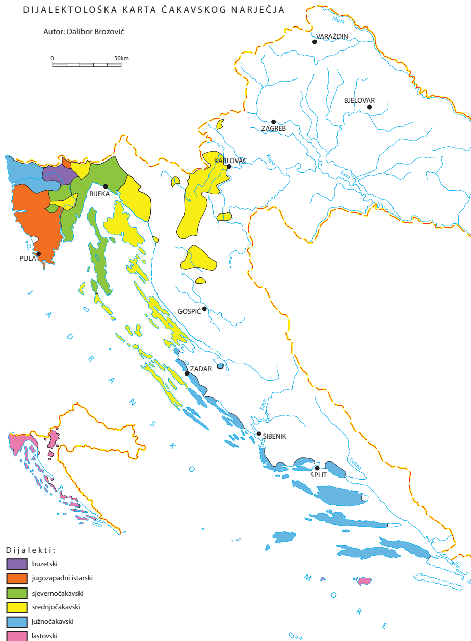
Čakavsko narječje (prema: Brozović & Ivić 1988)