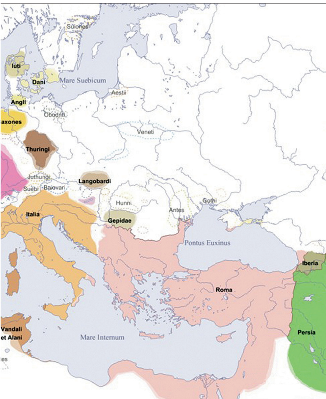
Europa oko 500. g. n. e.