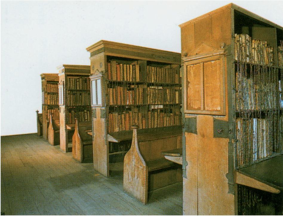
Police s knjigama, lancima povezanim, dio su klupa u srednjovjekovnoj katedralnoj knjižnici u Herefordu (Engleska), koja vuče podrijetlo iz srednjega vijeka.

šću poziciju ima, naprimjer, u liturgiji (po prirodi konzervativnom društvenu činu, gdje svećenik čita i tekstove koje već vrlo dobro zna napamet), pri radijskom izvještavanju, pri čitanju osobama oštećenog vida i djeci. 224